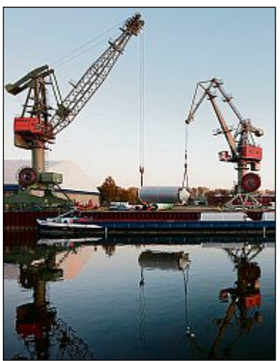
Im Hafen Regensburg wird Schwerkut verladen.

• Wertbringende Holzverwendung als Schlüssel zum Erfolg einer Branche: Zuerst eine weitestgehend stoffliche Nutzung des Holzes und das Restholz in die energetische Verwertung. • Politische Rahmenbedingungen für mehr Erfolg: Holzbau als fester Bestandteil der Studiengänge Architektur und Bauingenieurwesen sowie Vergabekriterien, die sich an der Zielsetzung der Energiewende orientieren, und ein CO 2 -Bonus für verantwortungsvolles Handeln. • Unternehmerische Eigenverantwortung als partnerschaftlichen Beitrag: Nicht nur Forderungen an die Politik richten sondern auch sich selbst fordern, in die eigene Sache „Berufsstand“ und „pro Holz Bayern“ zu investieren.