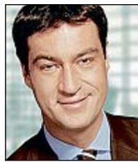
Von Finanzminister Markus Söder (CSU)

Die Debatte um die Staatsschuldenkrise hat das Jahr 2011 geprägt. Das Fazit liegt auf der Hand und bestätigt die finanzpolitische Tradition Bayerns auf voller Linie: Nur eine nachhaltige, moderne und aktive Finanzpolitik bildet die